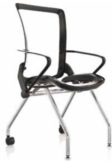
OSPITI - 4 GAMBE CON 2 RUOTE, 2 PIEDINI