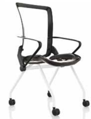
SEDUTA FINITURE NERE GAMBE BIANCHE