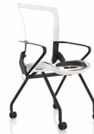
SEDUTA FINITURE BIANCHE GAMBE NERE