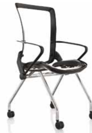
SEDUTA FINITURE NERE GAMBE LUCIDE