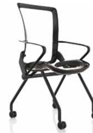
SEDUTA FINITURE NERE GAMBE NERE