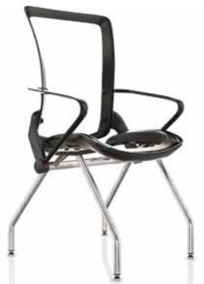
OSPITI - 4 GAMBE CON 4 PIEDINI