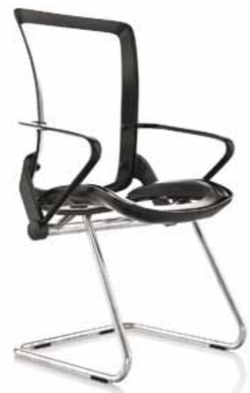
OSPITI - A SLITTA