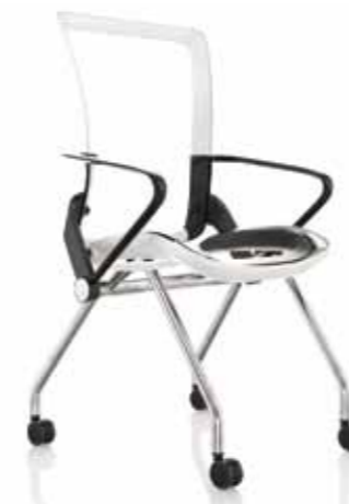
SEDUTA FINITURE BIANCHE GAMBE LUCIDE